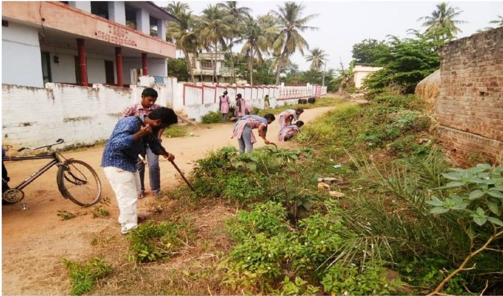
Swachha Bharat, Clean and Green Activity