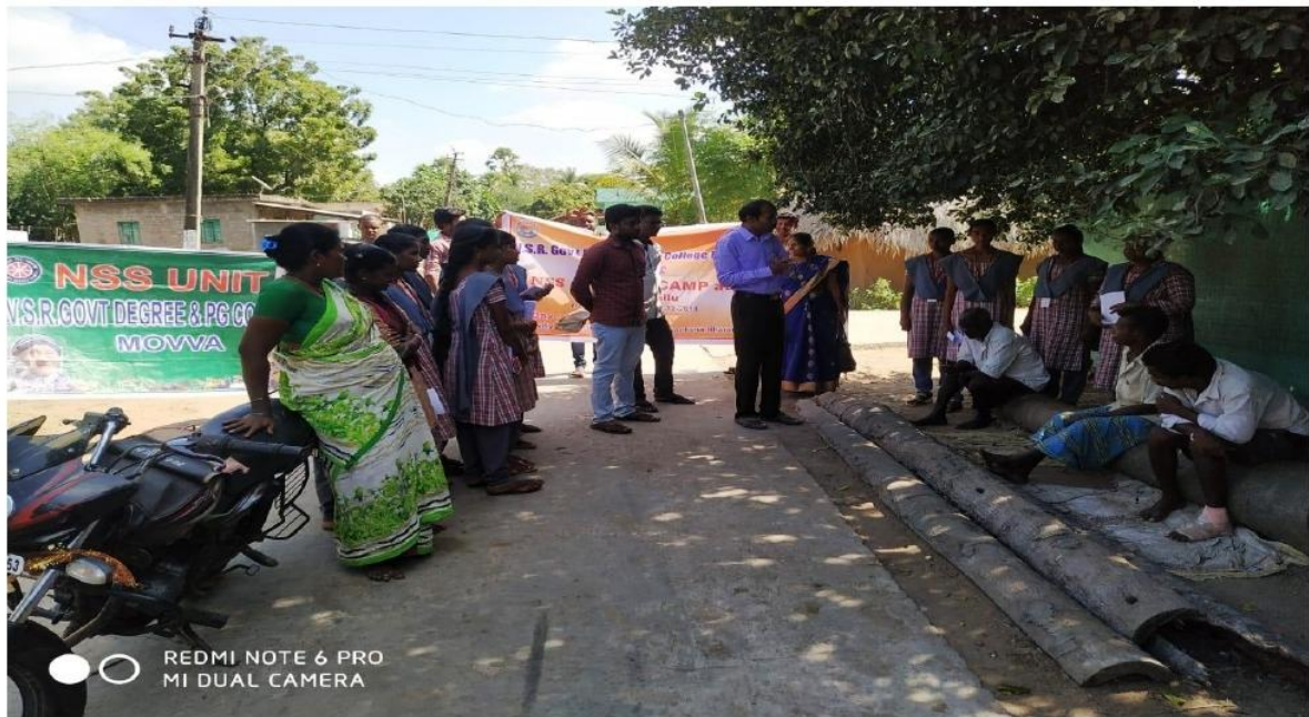
Door to door Campaign on Single-use plastic shopping bags