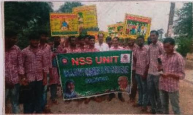
ఎయిడ్స్ పై ప్రచారం చేస్తున్న ఎన్ఎన్ఎన్ వలంటీర్లు