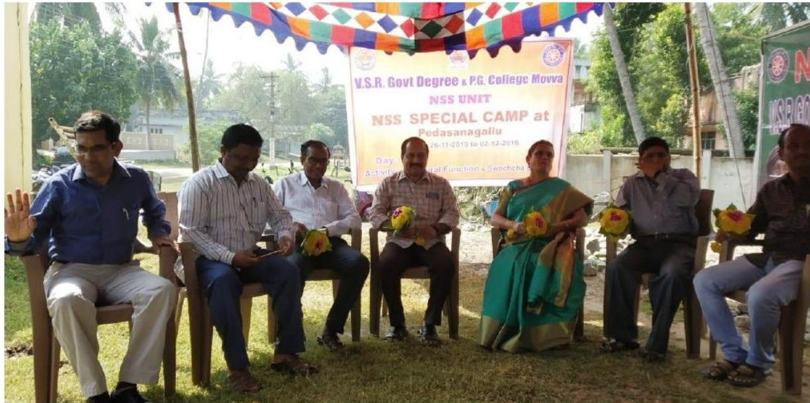
NSS Special Camp Inaugural Function