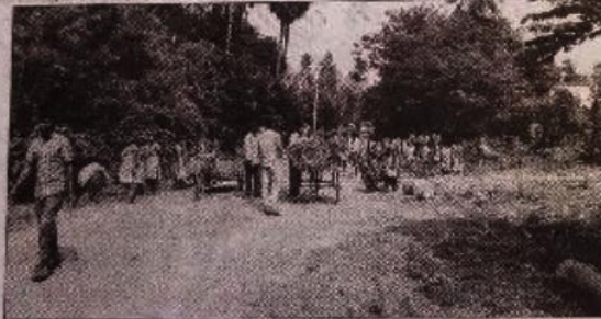
స్వచ్ఛ కార్యక్రమంలో పాల్గొన్న కళాశాల విద్యార్థులు