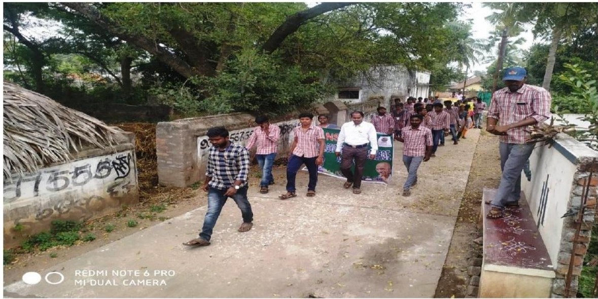
Awareness programme on AIDS/HIV at Pedasanagallu village