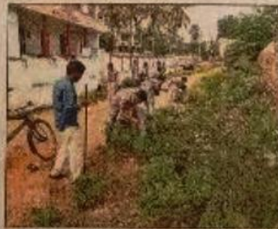
ముక్తకంప తొలగిస్తున్న విద్యార్థులు

పెదపనగల్లు (కూచిపూడి), స్టూన్ టుడే : పె డపనగల్లులో మొవ్వ వీఎస్ఆర్ ప్రభుత్వ డిగ్రీ వీజీ కళాశాల ఎన్ఎస్ఎస్ శిబిరం కొనసాగు తోంది. బుధ