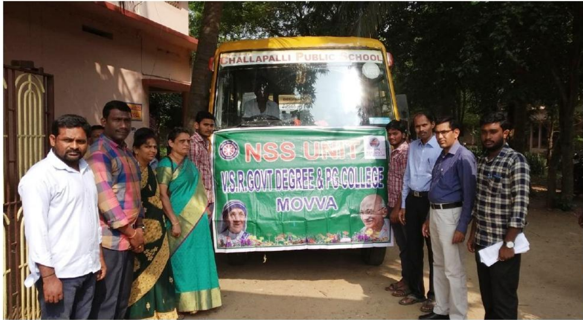
NSS Students Journey by bus