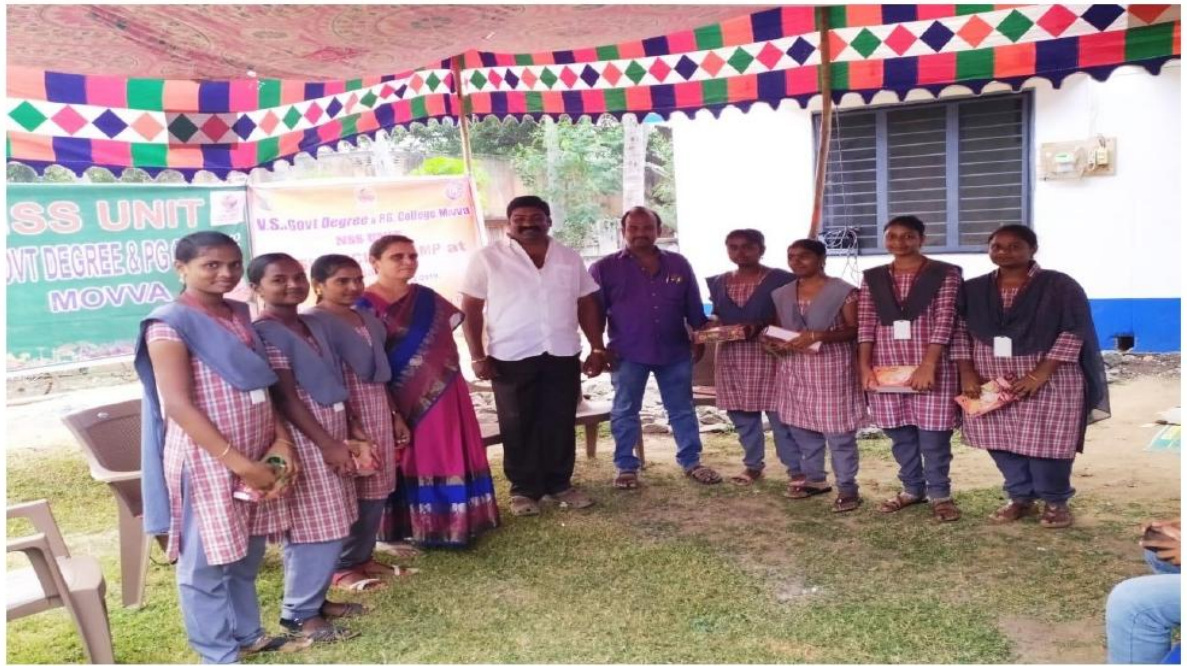
Gifts were distributed to the winners.