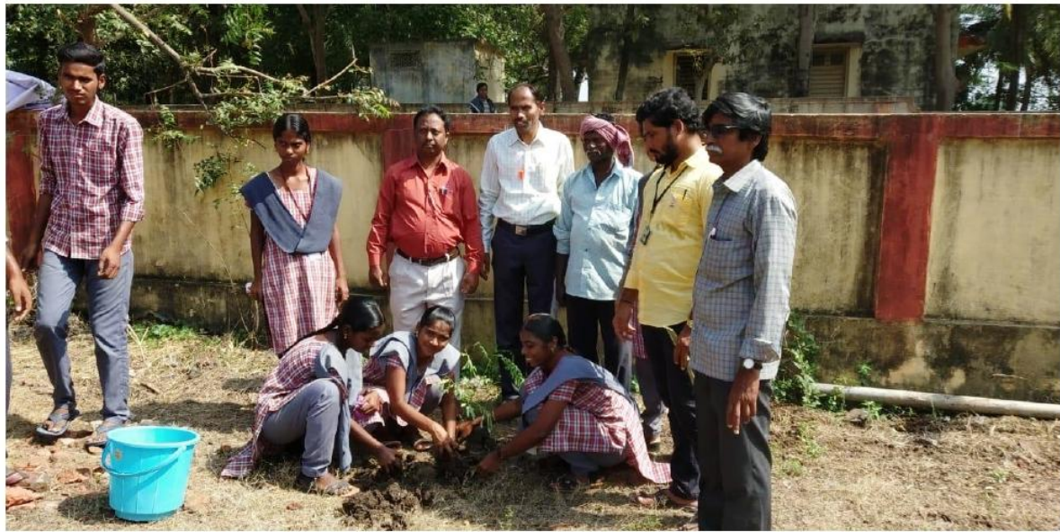
Vanam – Manam Activity