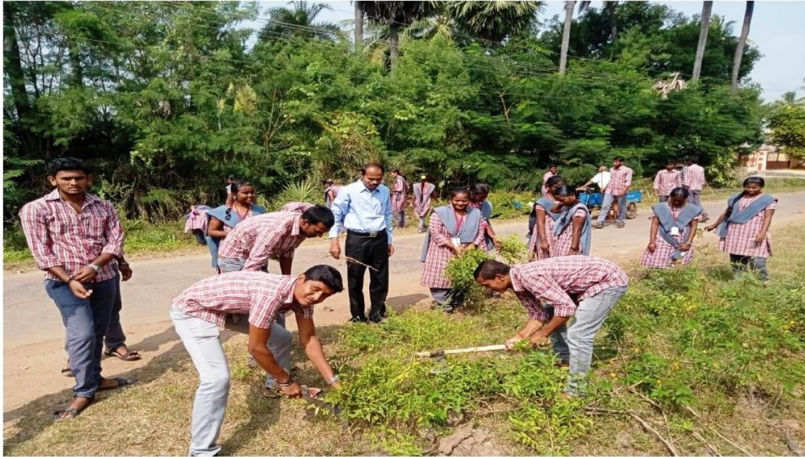
Swachch Bharat Program