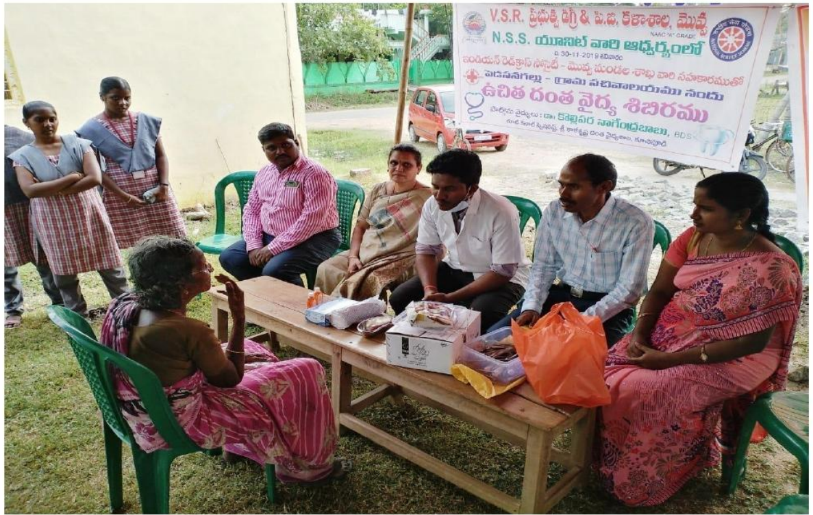
Free Medical Camp (Dental)