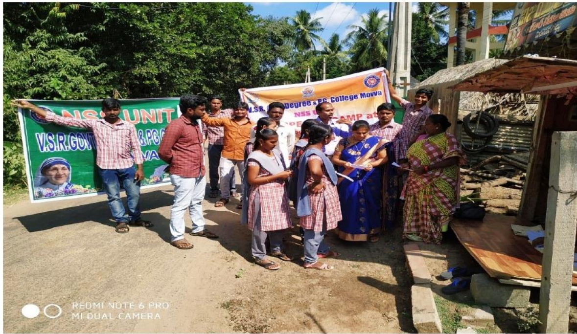
Door to door Campaign on Single-use plastic shopping bags and Free Medical Camp