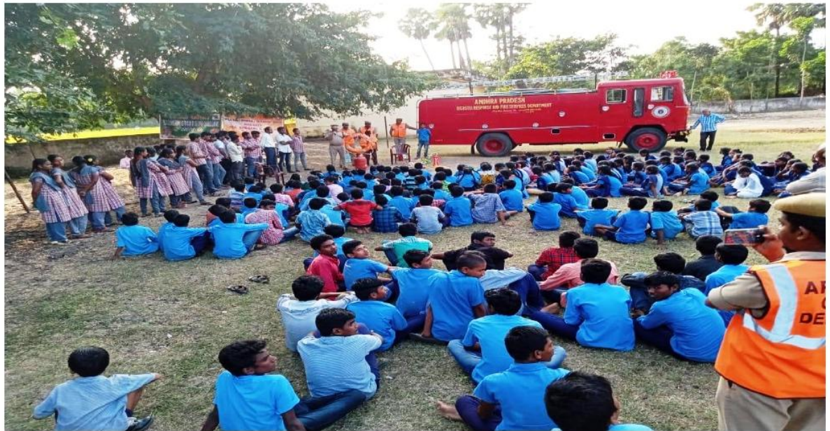
A workshop on Disaster Management