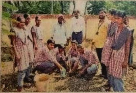
మొక్కలు నాటుతున్న ఎన్ఎస్ఎస్ వాలంటీర్లు