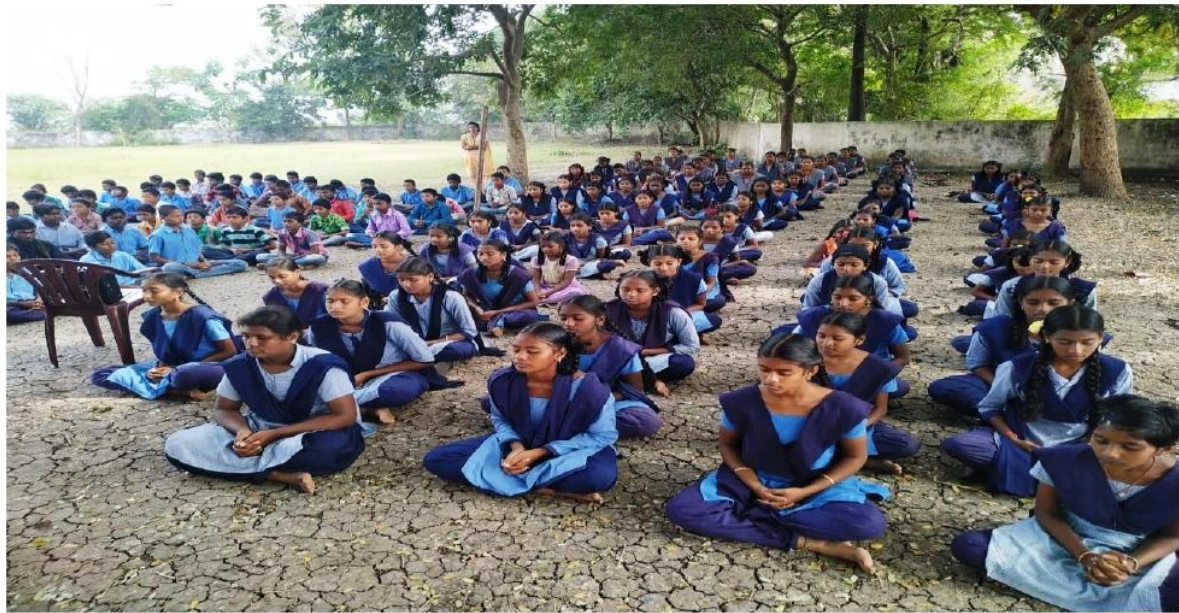
Meditation Class to Student of Z.P.P. High School